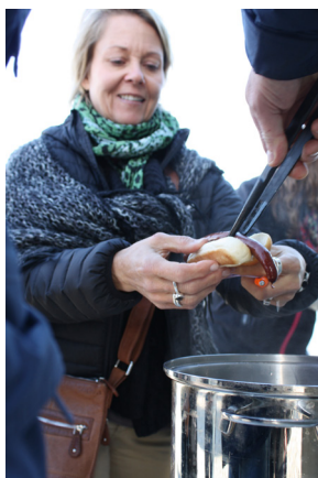
Alla 200 korvar gick åt!

Ett sextiotal medlemmar hittade vägen upp till Töftedalsfjället den 6 oktober trots tät dimma, men väl uppe på toppen skingrades slöjorna och dagen bjöd på oklanderlig höstsol och friska vindar.