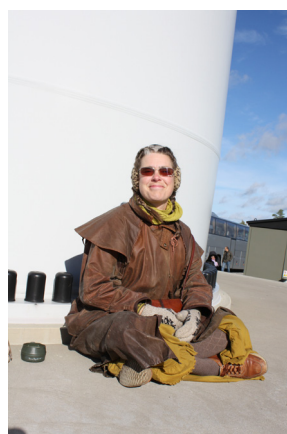
Fika i solen vid Elvys fot.

Under dagen avslöjades också vilket namn vårt verk har fått. Många fyndiga namnförslag trillade ner i brevlådan under namntävlingen som utlystes efter sommaren, men tyvärr kan ju bara ett förslag vinna. Samtliga inskickade förslag listades och styrelsemedlemmarna fick därefter rösta på det förslag