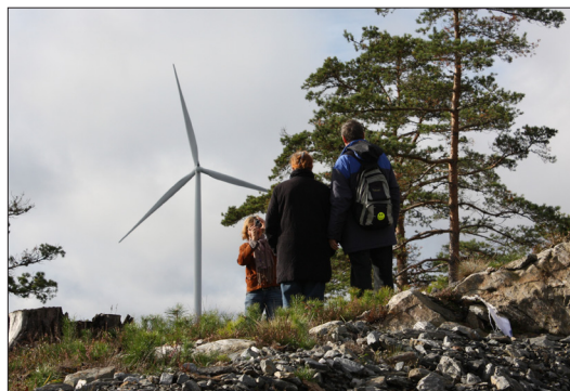
Kamerorna smattrade runt omkring verket.